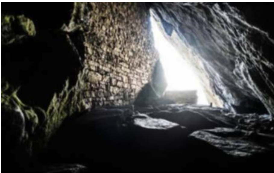
Forfatteren Sigrid Undset kaller Sunnivahola «Norges eldste kirketak». Kongen Olav Trygvason skal ha gjort hulen til kapell etter at bønder kom til ham med en hodeskalle som Trygvason regnet som levninger av en helgen.

de en indre og ytre reise. Han ønsker å motivere til å oppleve natur og fremme undring.